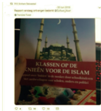
AFBEELDING 7: Tweet geretweet door PVV Arnhem

Civitas Christiana heeft in april 2018 in Arnhem opgeroepen tot een cordon sanitaire rond de politieke partij DENK. Dit bericht is naar meerdere steden gestuurd waar DENK deelnam aan de verkiezingen. Het was een oproep tegen de politieke islam, die bedreigend zou zijn voor Nederland. Het zou de Nederlandse soevereiniteit ondermijnen. 95 Civitas Christiana zendt zo nu en dan folders en materiaal uit. PVV Arnhem retweet in juni 2018 op Twitter een bericht van een fractievoolger (zie afbeelding 7) dat hij het document “Klassen op de knieën voor de Islam” van Civitas Christiana heeft ontvangen. 96