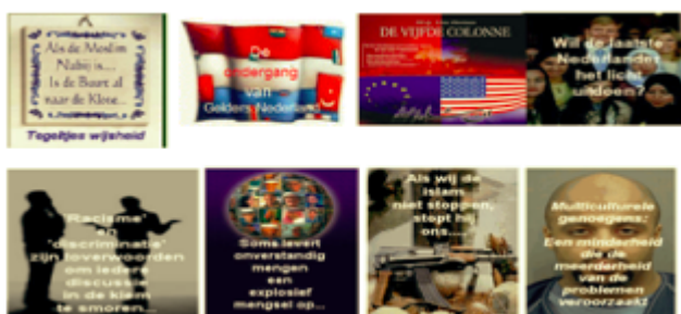
AFBEELDING 6: Plaatjes op de website van de Gelderse Centrumdemocraten

Op de website van de Gelderse CD staan diverse uitingen. In één van de uitingen wordt kritiek geuit op de in hun ogen inbezitneming van het Avondland door islamitische immigranten. 71 Ook spreekt de site over een dreiging vanuit vluchtelingen, allochtonen, gelukzoekers. 72 Onder het websitekopje “diversen” 73 zijn de volgende afbeeldingen te vinden, zie afbeelding 6: