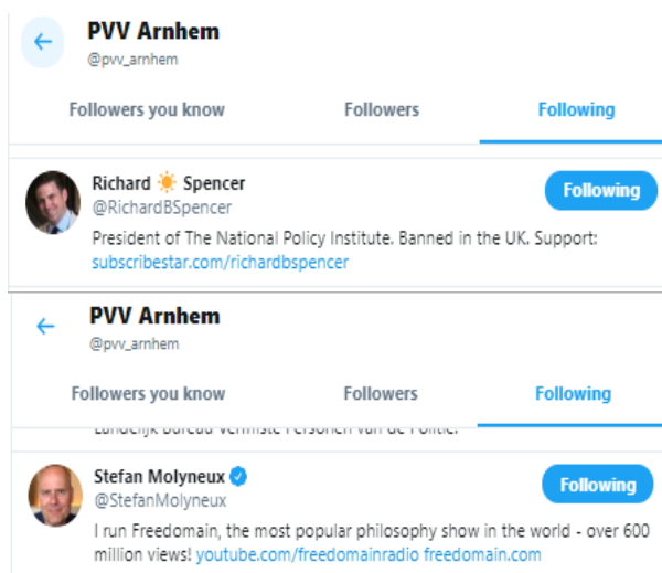
AFBEELDING 8: PVV Arnhem volgt Stefan Molyneux en Richard Spencer

Zoals te zien in de onderstaande afbeelding, volgt de Twitter-pagina van PVV Arnhem onder andere Stefan Molyneux (een YouTube- en Twitter-influencer 169 ) en Richard Spencer (denktankleider 170 ). Dit zijn twee invloedrijke figuren die door velen gezien worden als 'white supremacist'. 171 Richard Spencer is bijvoorbeeld de toegang tot de Schengenzone ontzegd. 172