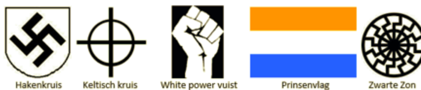
AFBEELDING 5: Symbolen gebruikt door extreemrechts

Traditioneel gezien is bij extreemrechts een fascinatie voor symboliek en identiteitsuitingen gerelateerd aan de klassieke oudheid, 15 Germanen, (kruis)ridders en nazisme. 16 Deze tijdperken en groepen worden gebruikt en gezien als boegbeelden van de witte, westerse, Europese beschaving. Extreem-rechts gebruikt ook symbolen om zichzelf te identificeren. Voorbeelden hiervan zijn het nazistische hakenkruis, 17 Keltisch kruis 18 en 'de 14 woorden': " We must secure the existence of our people and a future for white children. " 19 Ook bekend zijn de White Power-vuist, 20 de prinsenvlag die met de NSB en de Apartheidsbeweging verbonden is 21 en de zwarte zon, die door de SS gebruikt is. 22 Zie afbeelding 5 voor een visuele weergave van de genoemde symbolen.